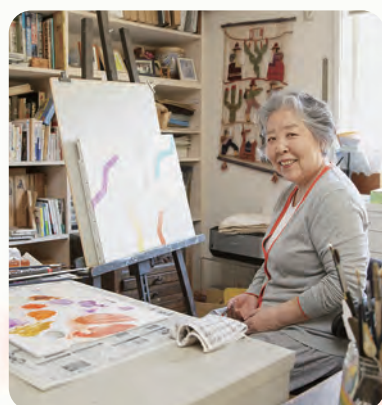
西巻茅子プロフィール

1939年生れ、東京芸術大学工芸科卒業。 出版50周年の『わたしのワンピース』など 読み継がれている絵本多数。 子ども・絵本づくりについてのエッセイ集 『子どものアトリエ 絵本づくりを支えたもの』