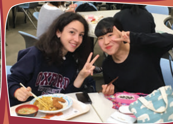
ランチタイムも一緒に