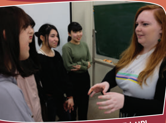
ゲームやおしゃべりをしながら英語力UP!