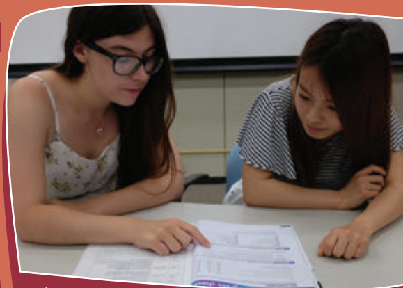
インターン生は課題やテスト勉強の強い味方!