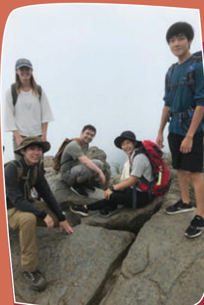
一緒に旅行を楽しんで、友情を深めよう