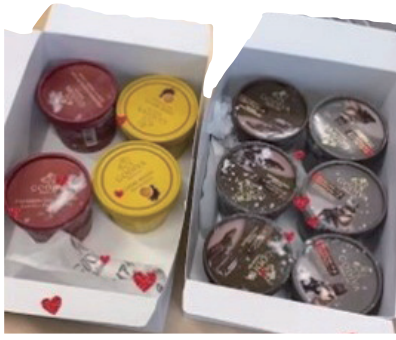
↑ 1位のグループの景品のハーゲンダッツ♡

今年も恒例の新入生交流会が5月21日（土）に開催されました。 今年もキルギス、ベトナム、インドネシアが各2チーム、韓国、ウクライナが1チーム発表を行いました。 留学生と新入生が協力してプレゼンテーションを行い、文化交流学科らしい交流会となりました。