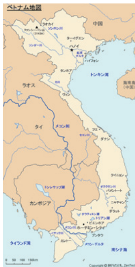
▶ベトナムの地図。おすすめの場所のフエは中間くらいにあります。