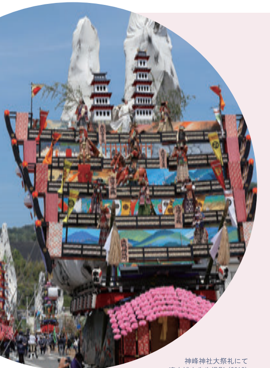
神峰神社大祭礼にて (2019)

C科では海外留学や地域に関わるボランティアに参加することができます！長期休みを利用したプログラムも多く、きっと自分にぴったりのものが見つかりますよ。気になる方は、早めに地域交流センターに行ってみることをおすすめします。