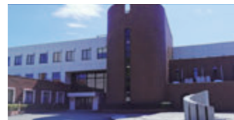
▲上が11号館、下がシオン館。とりあえずこの二つは覚えておこう。