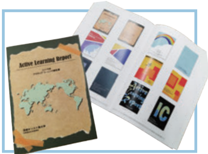
▲授業での作品が学校で出版する資料に実際に使用されることもあります。画像左は2020年度の優秀作品がC科の「アクティブ・ラーニング報告書」の表紙になったもの。就活のネタになるかも！

の練習の場を探すのはなかなか難しい。まず機材の入手が困難だし、せっかく作ったものは誰かに見てほしい。それにアドバイスも欲しいし、なんて、悩みは尽きないですよ。 演習「編集技法」はデザインに興味があるけどなかなか機会がない、初めの一歩が踏み出せない、なんて方にとってもおススメの授業です。プロ仕様の編集ソフト「InDesign」の操作方法を学びながら、チラシやポスターのデザイン、記事のレイアウトに実際に挑戦することができます。 IllustratorやCLIP STUDIO PAINTなど、イラスト編集ソフトに馴染みのある人は、そのノウハウを活かれます。初めての人も、先輩や先生のサポートがあるので安心です。 「弘法筆を選ばず」とは言いますが、やはり環境と道具は大事。C科は他の学科と違い、自由な職業選択ができるのが特徴の学科です。その自由の中には当然、デザイン業界も含まれます。新入生も、先輩も、「編集技法」で、最初の一歩を踏み出してみませんか。