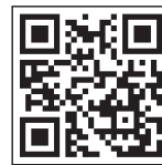
スマートフォン用