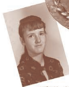
スポンサーからのプレゼント

また、アメリカの往年の人気歌手パット・ブーンもデビュー以前から「5ドル献金」を続けていた熱心な後援者だっ