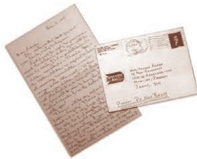
スポンサーとの文通カード

「ZION」発行への寄付のお願い 15,000人以上の卒業生への「ZION」発行と送料で200万円以上が必要です。毎年資金が不足しております。一人20,000円以上のご協力をお願いします。 (「ZION」紙に同封の振込用紙をご使用ください)