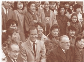
パット・ブーンが来園(1964年)