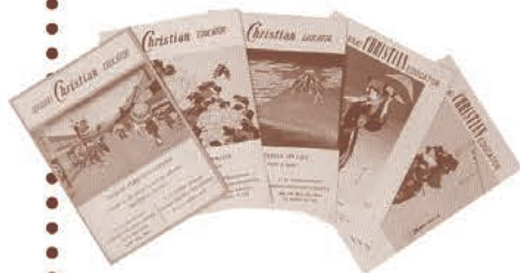
茨城クリスチャン・エドゥケーター

このような様々なエピソードを秘めながらこの制度も1970年頃まで続いたが、時代の流れと共に終息となった。昔の生徒達にとっては懐かしい思い出となっているだろう。