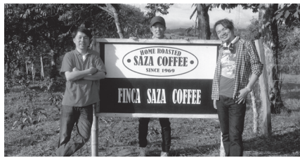
コロンビア・サザ農園