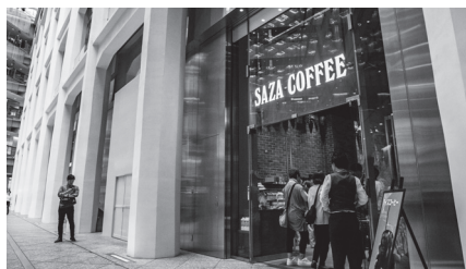
昨年7月に開店した、サザコーヒー KITTE 丸の内店

る超多忙な日々を送っている。 また、自分が食べたいものをより安全な食品として提供することをモットーにし、その対策も怠らない。太郎さんのもう一つのこだわりは、販売用のコーヒーを入れる袋の開発。袋の内側をアルミ箔、ポリフィルム、ポリウレタンの3層構造にすることにより、コーヒ