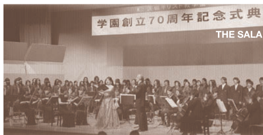
ハレルヤの大合唱