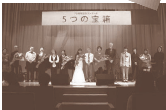
記念コンサート「5つの宝箱」