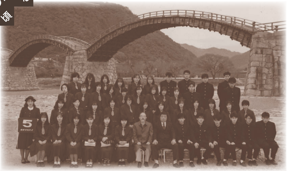
修学旅行で訪れた「錦帯橋」で(1987年)