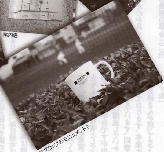
マグカップのモニュメント?