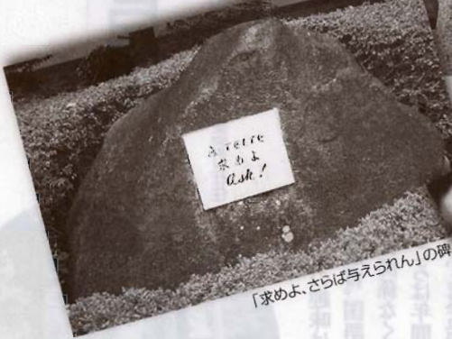
「求めよ、さらば与えられん」の碑