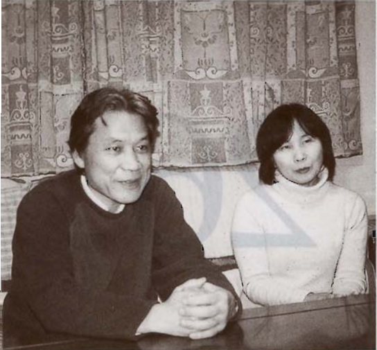
たっぷり1時間、楽しいお話を伺いました