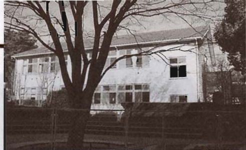
平成15年3月に解体された「旧記念館」

内部に同窓会事務局と同窓生集会室ができます 目標額2千万円、現況額550万円 平成19年度まで復元資金を集めます!