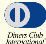
ダイナースクラブ

*コンビニエンスストア決済* 決済が行えるコンビニエンスストアは以下の通りです。