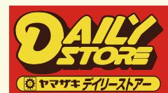
ヤマザキデイリーストア

コンビニエンスストアでご決済いただく場合、70周年記念サイト専用申し込みフォームからどうぞ。