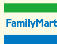
ファミリーマート